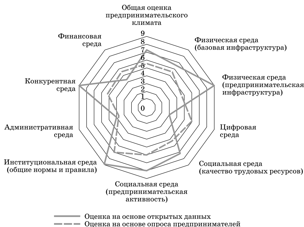
Рис. 2. Распределение оценок респондентов степени благоприятствования конкурентной среды в Смоленской области (1 — крайне неблагоприятная, 10 — максимально благоприятная)

нами власти в целях закупки товаров, работ или услуг для государственных и муниципальных нужд, отвечали также на вопросы о том, сталкивались ли они с нарушениями при проведении конкурсных процедур и какого рода нарушения допущены органами власти. В опросе приняли участие 48 предпринимателей Смоленской области. Респондентами выступали собственники организаций и предприятий региона, которые осуществляют управление компаниями, и индивидуальные предприниматели. Из них 19 компаний (40 % опрошенных) относятся к категории микропредприятий, 18 компаний (38 %) — к категории малого предпринимательства, четыре компании (6 %) — к категории среднего предпринимательства, семь компаний (16 %) — индивидуальные предприниматели.