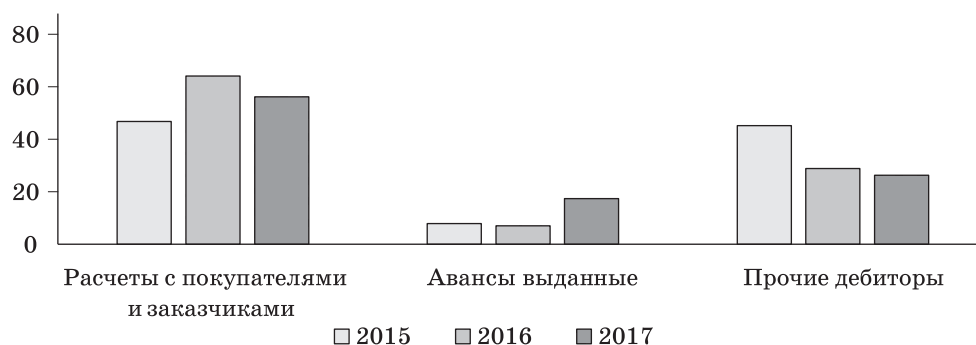
Рис. 2. Структура дебиторской задолженности АО «Концерн Росэнергоатом» в 2015–2017 гг., %

Данные значения являются достаточно низкими, что свидетельствует о неэффективном использовании имеющихся в распоряжении предприятия основных фондов. Среднесписочная численность работников в 2016 г. — 35 394 чел., в 2017 г. сократилась на 1 507 чел. (на 4,3 %), в 2018 г. характерно незначительное увеличение — на 37 чел. (0,11 %).